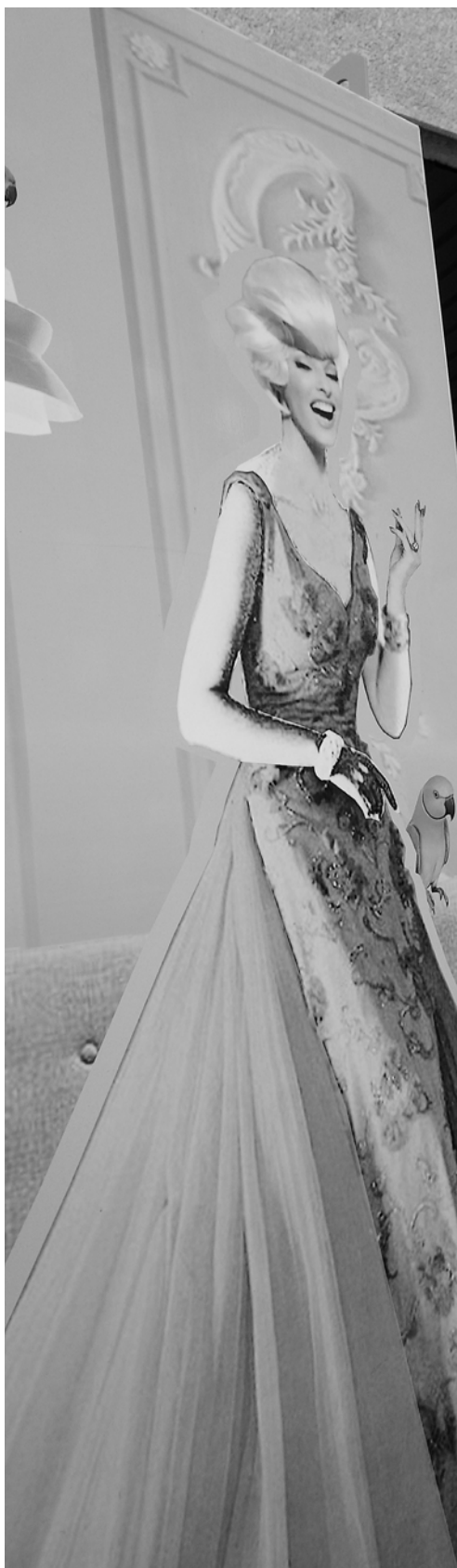
oeuvre intitulée "Auntie Mame Light Blue" de Drew Mandigo