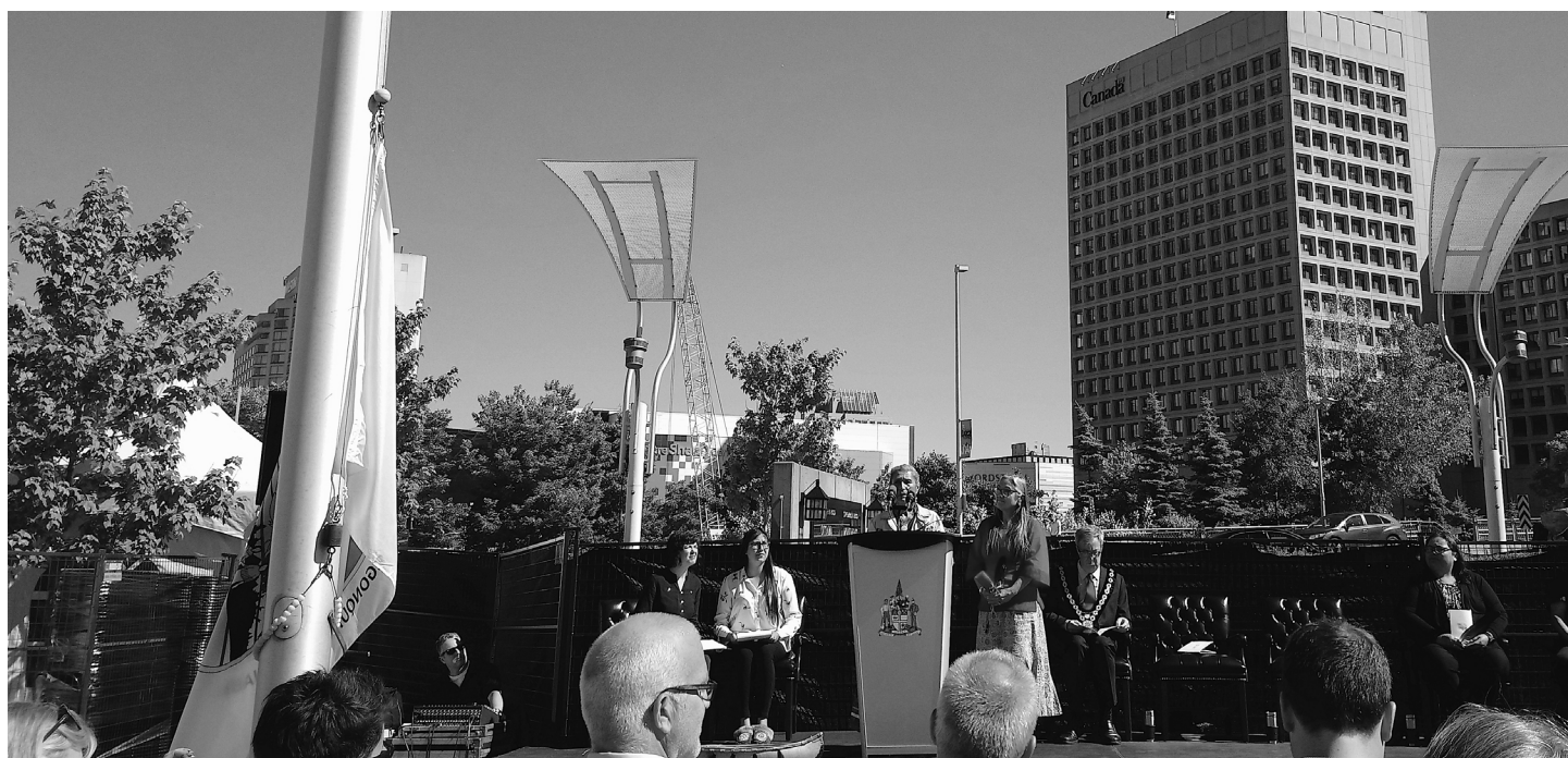
Tableau 27 : Croissance du nombre d'Autochtones travaillant dans une profession culturelle, de 2006 à 2016